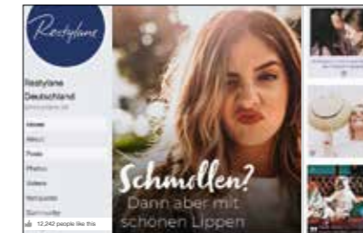
Restylane Social Media