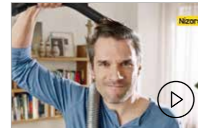
Nizoral/Terzolin Internationale Kampagne (EMEA)

1 A Pharma • AbbVie • Almirall Hermal • Amgen • Apomedica • Astellas Pharma • ATRO ProVita • Bausch + Lomb • Bauerfeind • Bayer Vital • Berlin-Chemie • Chiesi • CP GABA • Daiichi Sankyo • DHU Arzneimittel • DKMS • DR. KADE • Dr. Loges • Dr. Pflieger • Dr. Willmar Schwabe • Eduard Gerlach • Eisai • Engelhard • FERRING • Fresenius • Galderma Laboratories • GC Germany • G. Pohl-Boskamp • Grünenthal • GSK • HERMES ARZNEIMITTEL • Hevert • Hormosan • Intercept Pharma • Janssen-Cilag • Johanniter Unfallhilfe • KaVo Dental • Krewel Meuselbach • Kulzer • Lilly • Lundbeck • MEDA Pharma • MEDAC • MEDICE • Merck • Merial • Merz Pharma • MUCOS • Mundipharma • Nestle Health Science • Norgine • Novartis • Novo Nordisk • Orion Pharma • Orthim • Orthomol • Paul Hartmann • Philips Consumer Health • Pierre Fabre • Pink Ribbon • R & V Versicherung • Riemser • Roche Pharma • Salus • Schaper & Brümmer • Servier • Shire • STADA • Takeda Pharma • Techdow • TEVA • Trommsdorf