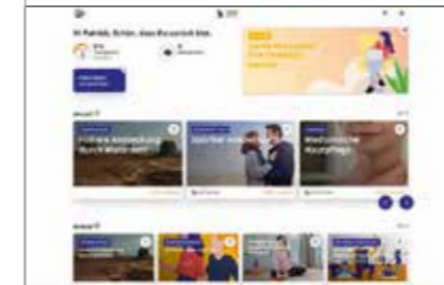
PTA Channel Edutainment-Plattform