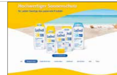
Ladival Website, SEO