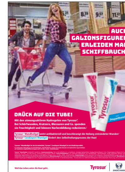
Tyrosur Neuausrichtung Marke